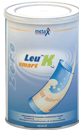
ZeroLeu smart K 2 x 500 g Dose PZN: 03386885

ZeroLeu smart K für Kinder von 1 bis 6 Jahren